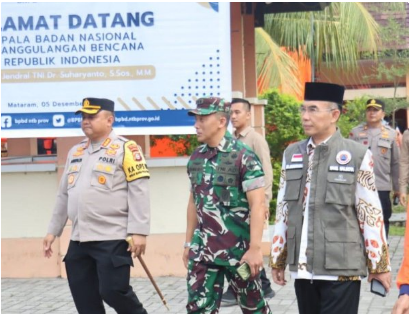
Kapolresta Mataram (Kiri) saat menghadiri acara Peletakan batu Pertama pembangunan gedung Pusdalops BPBD NTB, Kamis (05/12/2024)